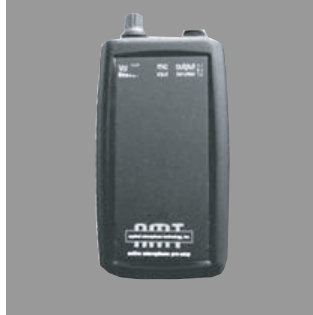
Belt Pack BP-40