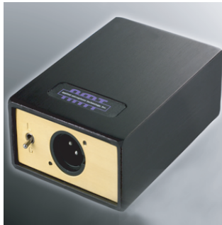
Floor Pre-amp AP40