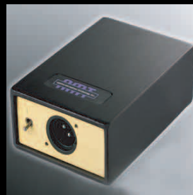
AP40 for S3G-STUDIO