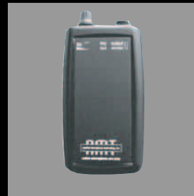
Belt pack Preamp for S3G